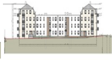
SCHEITEL & S. Ingenieurbüro