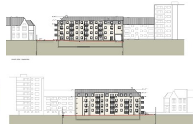
SCHEITEL & S. Ingenieurbüro

In Düsseldorf Gerresheim errichten wir an der Heyestrasse 51-53 vier Mehrfamilienhäuser mit insgesamt 61 Mieteinheiten als geförderten Wohnungsbau. Hierbei werden die Baukörper auf ein gemeinsames Untergeschoss aufgesetzt, welches als Tiefgarage, Technik- und Kellerbereich genutzt wird und die Häuser untereinander verbindet. Die Häuser reihen sich 3- bzw. 4-geschossig quer mit Flachdachkonstruktion als auch als Mansardendach mit Ziegeleindeckung in das Grundstück ein. Die Außenanlage umgibt den Gebäudekomplex zur Nachbarbebauung. Im Außenbereich befinden sich 70 Fahrradstellplätze. Über eine Durchfahrt gelangt man in die Tiefgarage, diese bietet Platz für 32 PKWs sowie weitere 55 Fahrräder. Auf der Tiefgaragendecke befinden sich Mietergärten, ein Spielplatz sowie diverse Sitzgelegenheiten, die zum Verweilen einladen.