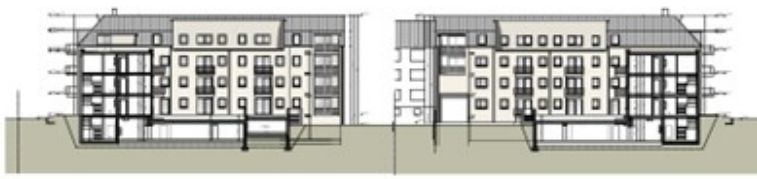
SCHEITEL & S. Ingenieurbüro