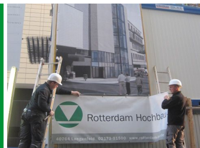
Ein Projekt der Rotterdam Hochbau