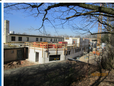
Ein Projekt der Rotterdam Bau GmbH